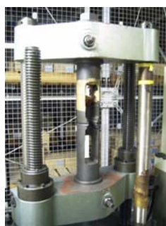
引張試験機 ■試験体の引張強度を調べることができます