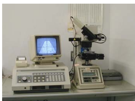
マイクロビッカース硬度計 ■金属の表面硬度を計測します