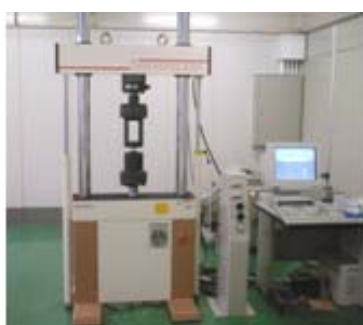
疲労試験機 ■破壊までの繰返回数と変形過程を計測します