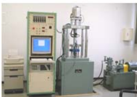
SDCねじ性能試験機 ■ねじの締付特性を計測できます