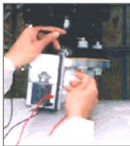
SDC防食ボルト(SUS304) ＜設置例＞