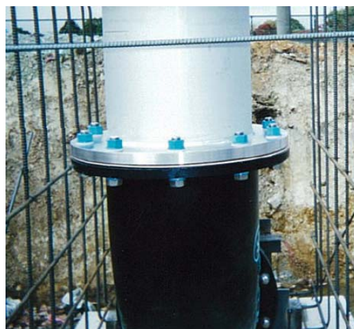
ステンレス管と鋳鉄管接合による 電食防止