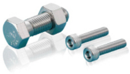
SDCクリーンボルトシリーズ

コンタミの原因となる潤滑剤、不純物等一切なし！ クリーンな環境でのねじの焼付き問題を解決します！